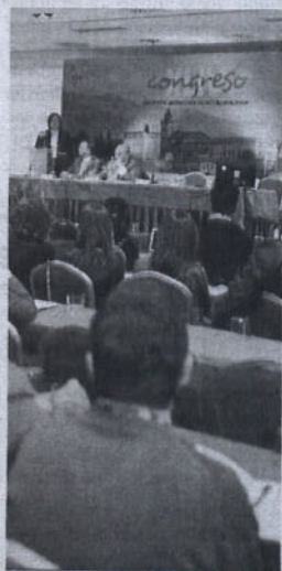
Un momento de las jornadas. M.R.

Asimismo, gran parte de la programación la acapara la cirugía refractiva. Los expertos también analizarán estos días las inyecciones intravitreas.