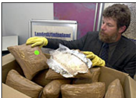
Cargamento de droga incautado por las autoridades alemanas en el 2001.

Enlaces - Oficina suiza de Salud Pública