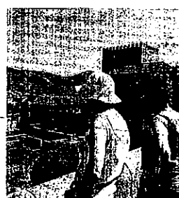
La Alhambra fue objeto de aviso.

AMENAZAS. El hombre que irrumpió el pasado 2 de abril en la emisión en directo de un teledebut de TVE ha sido detenido en Santiago de Compostela como autor de decenas de amenazas de bomba. Entre otros lugares, el hombre fue el autor de una amenaza de bomba falsa en el complejo monumental de Alhambra de Granada.