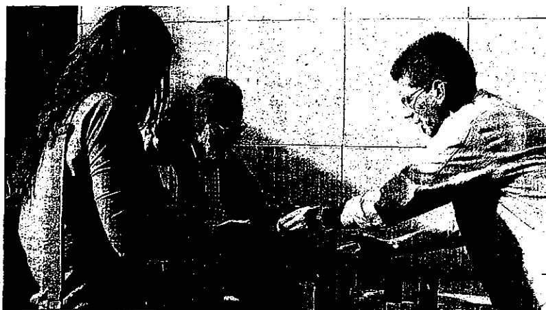
Los vecinos llevaron velas, un elemento ya indispensable en sus casas.

Muertes se han producido en la red viaria de la provincia desde el pasado 1 de enero