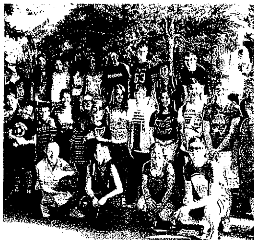
Imagen de los niños que acuden a la Escuela de Pacientes de Verano.

Los niños realizarán actividades como ruta interpretativa de la fusión de la nieve, tour guiado del cielo nocturno, además de natación, patinaje sobre hielo, bicicleta o trineo ruso.