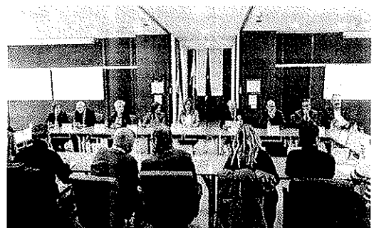
Reunión de la presidenta con los afectados por la hepatitis C.

Díaz reiteró además el compromiso de que en Andalucía los pacientes seguirán teniendo como hasta ahora “garantizado el acceso a los tratamientos que les han prescrito sus médicos”.