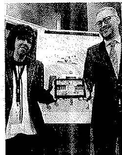
La app, 'Artrimedia'

Los contenidos que se trabajarán en los talleres del aula de artritis responden a las necesidades de formación e información que han identificado las asociaciones de personas que conviven con esta patología, tanto desde la perspectiva del paciente, como de sus familiares y personas cuidadoras. Estos talleres se irán desarrollando en