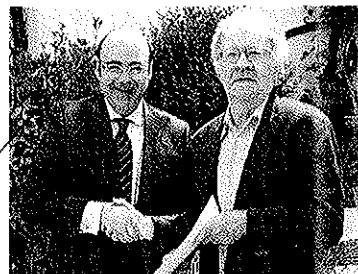
PEPE VILLOS / ON

53 LA DIPUTACIÓN ADQUIERE EL ARCHIVO DE LUIS BUÑUEL