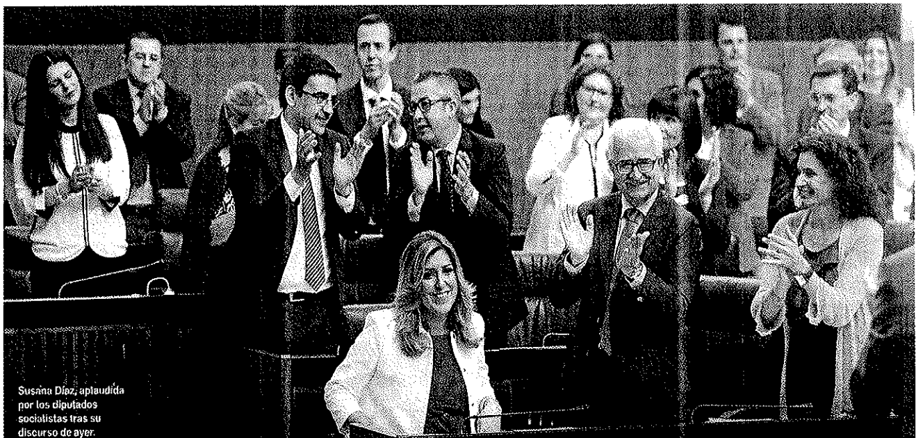
Susana Díaz, aplaudida por los diputados socialistas tras su discurso de ayer.

● La presidenta presenta un amplio programa contra la corrupción y anuncia 135 actuaciones que recogen muchas reivindicaciones de la oposición