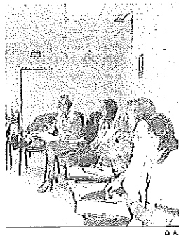
Una de las sesiones.

Almería ha inaugurado un aula de la Escuela de Pacientes centrada en enfermedad renal, con un taller en el que han participado pacientes que quieren formarse como formadores para ayudar a otras personas a afrontar las diferentes fases de este proceso. Además, los pacientes han contado con el apoyo de los profesionales sanitarios de la Unidad de Gestión Clínica de Nefrología del Complejo Hospitalario Torrecárdenas, que los apoyarán en la realización de los talleres a pacientes recién diagnosticados. De este modo, este se convertirá en un espacio de información e intercambio de experiencias. Su objetivo: mejorar la calidad de vida de personas con enfermedad renal, a través del intercambio de experiencias, consejos, etc.