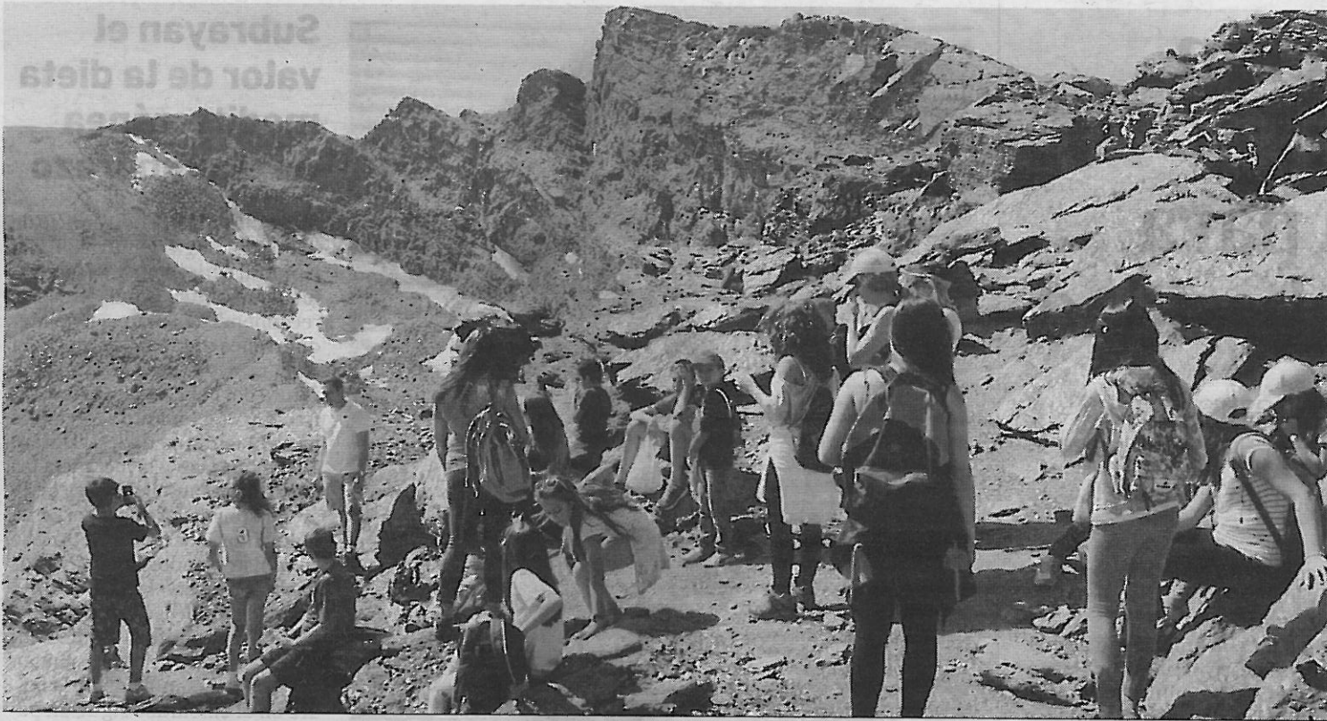
La escuela de verano supone una alternativa de ocio, diversión y formación.