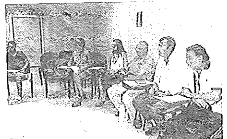
ESCUELA de pacientes renales en Torrecárdenas.

Aprenden, señalan desde Salud, a poner en marcha una o varias actividades concretas para su vida diaria, que cada uno se propone realizar para conseguir unos objetivos de mejora en su salud y calidad de vida. Alimentación, ejercicio físico, descanso, cuidados de la fístula o relaciones sociales son temas que abordan durante las sesiones.