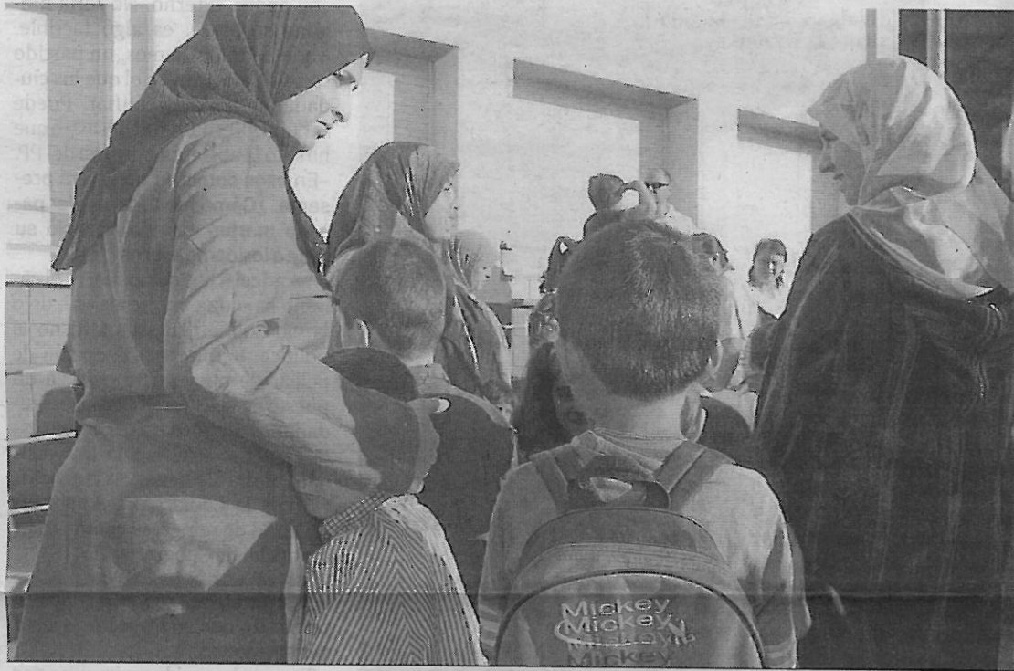
El informe también analiza el papel que desempeña la educación en la infancia.