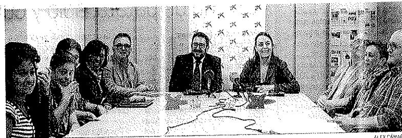
Los alumnos y profesores de Ciudad de los Niños junto a los coordinadores del taller, ayer en rueda de prensa.

participación de los estudiantes. El resultado de esta votación es el siguiente: Día de los Cuentos; Día de las Palabras; Día de los libros y Día de los lectores a secas.