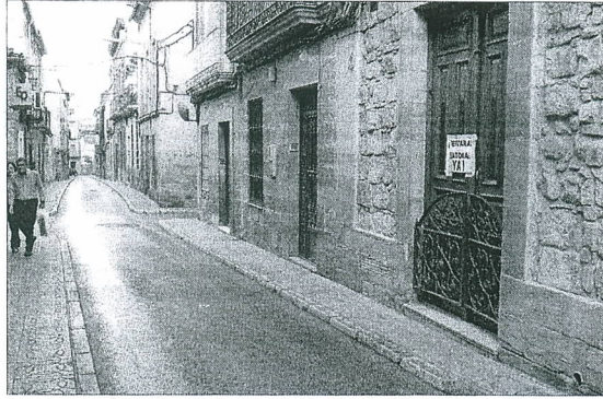
PEATONALIZACIÓN. Vista de la estrecha calle Ventanas.