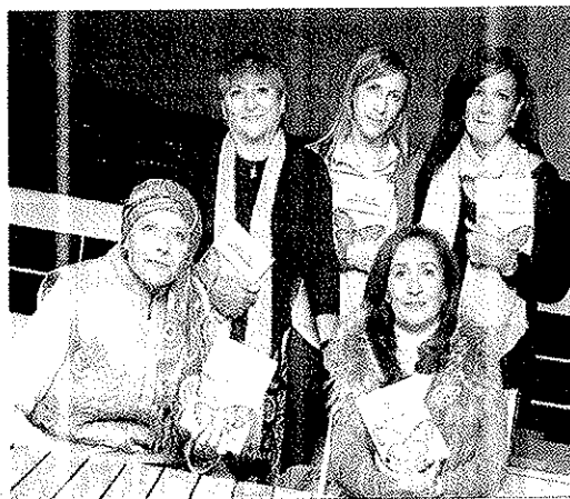
'Mariposas en el corazón' es la historia de cinco luchadoras.