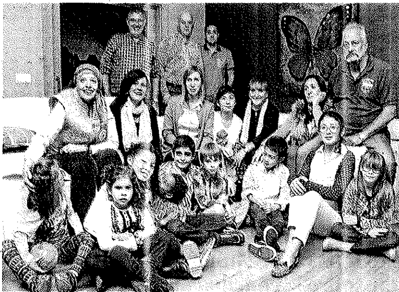
Niños y padres han conseguido formar una gran familia.