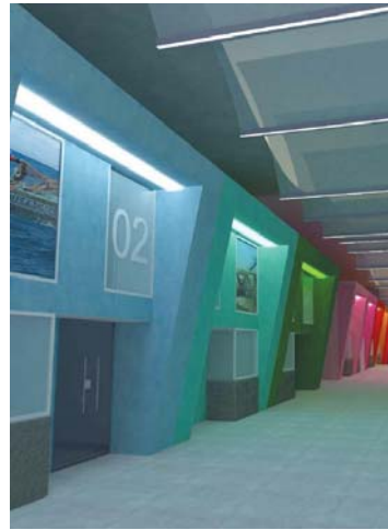
Imágenes del exterior y el interior de la Ciudad del Marisco según el anteproyecto de acondicionamiento de las naves. VH

restauración y otra como servicios complementarios a la propia actividad.