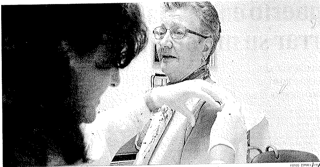
El programa de prevención se inició el pasado mes de octubre en los centros de salud.