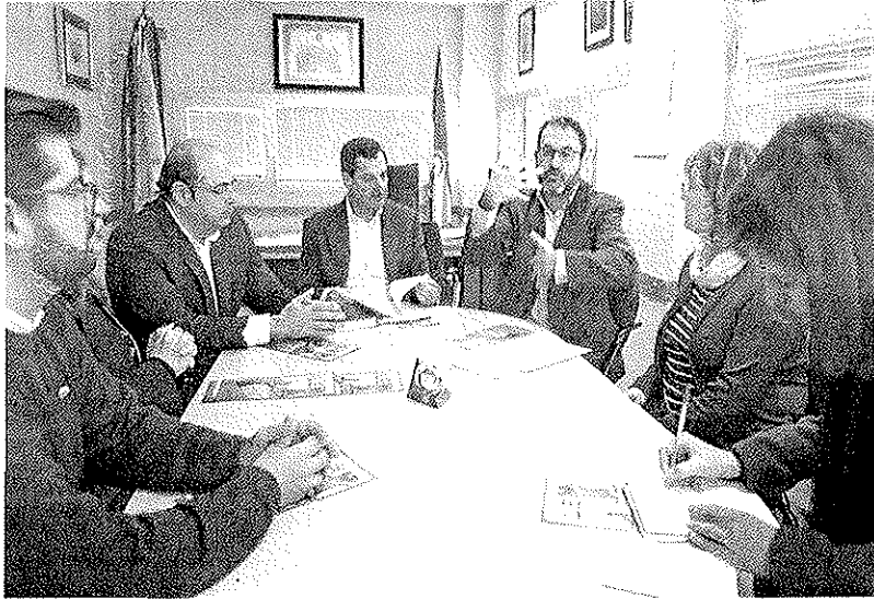
Juanma Moreno, durante su visita a la sede de la Federación de sordos.

Asimismo, lamentó que la Junta de Andalucía se esté basando en «problemas o chapuzas administrativas» de épocas anteriores para no atender al pago de las deudas que tiene con la