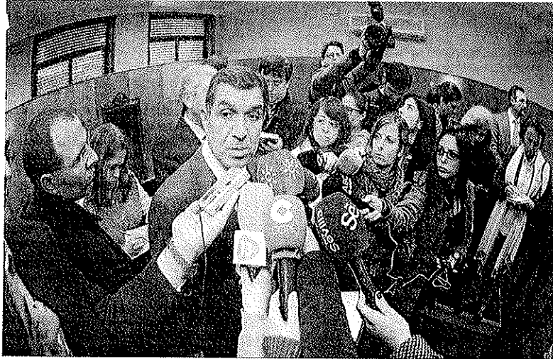
El presidente del TSJA, Lorenzo del Río.

La Sala de Gobierno responde así a la comunicación remitida por el Presidente de la Audiencia de Granada y el decano de los Juzgados de Granada en la que detallaban los problemas de reparto de las demandas presentadas telemáticamente y solicitaban la posibilidad de suspender el sistema de presentación telemática y quién podría dictar dicho acuerdo de suspensión. La Sala de Gobierno entiende que "la suspensión del siste-