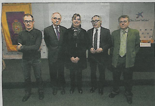
Ponentes, organizadores y autoridades.

Por el momento, Govern y Gobierno han acordado formalmente la creación de una comisión política que deberá resolver las discrepancias de forma previa a la presentación del recurso.