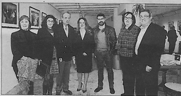
Foto de familia del equipo de SIFU y las autoridades. ■ Foto: JAUME MOREY

Los fotoperiodistas Quim Puig y Romuald Gallofré convierten las experiencias de sus protago-