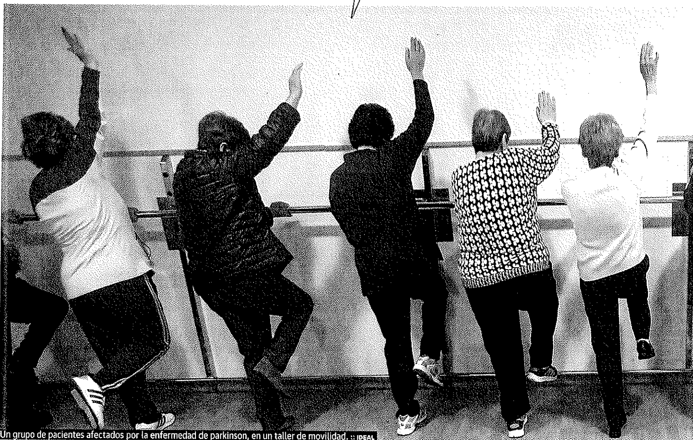
Un grupo de pacientes afectados por la enfermedad de parkinson, en un taller de movilidad.