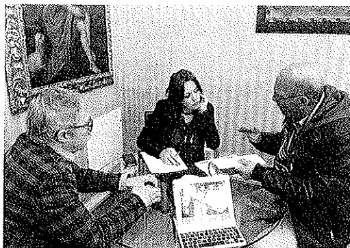
El presidente de la Alianza Mundial de Centros de Longevidad ha visitado la ciudad.