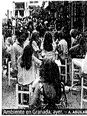
Ambiente en Granada, ayer.

Un sector que nunca falla a Granada es el turismo. El puente del Corpus, que no es fiesta en el resto del país, llenará de nuevo la ciudad de visitantes con una ocupación que algunos días alcanzará el 95%, prácticamente el lleno, debido también a un macrocongreso médico que empieza hoy y acaba el sábado en el que participarán cerca de 5.000 personas. El turismo y los congresos son siempre sinónimos de riqueza para la ciudad y para la provincia. Ojalá hubiese muchos como éste.