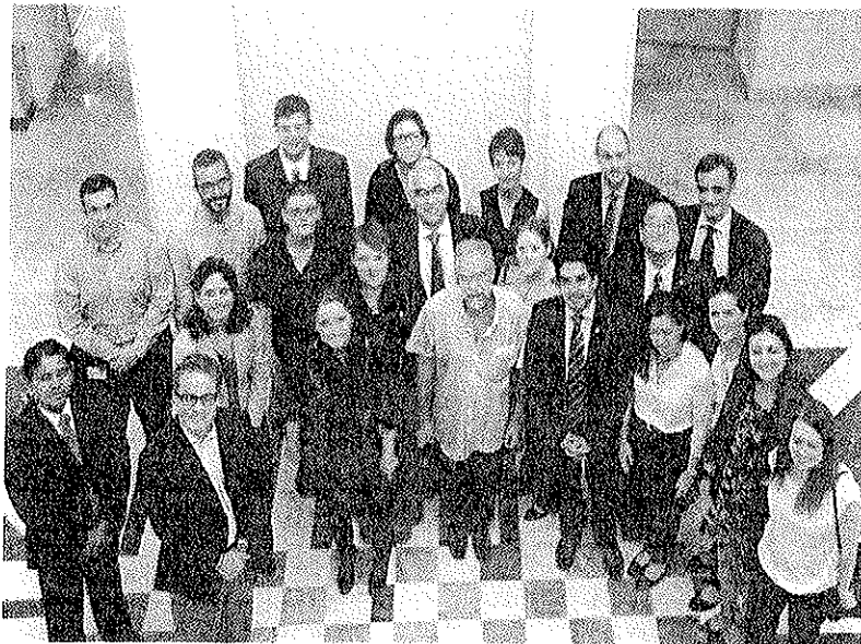
Asistentes a la reunión de trabajo que dio origen a la plataforma. ● IDEAL