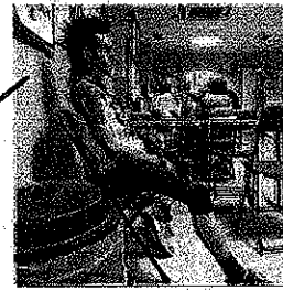
Centro de día de drogodependientes.

jer, especialmente en edad adolescente. En el informe, algunas personas profesionales enfatizan los frecuentes "problemas de salud mental" que sufren estas mujeres.