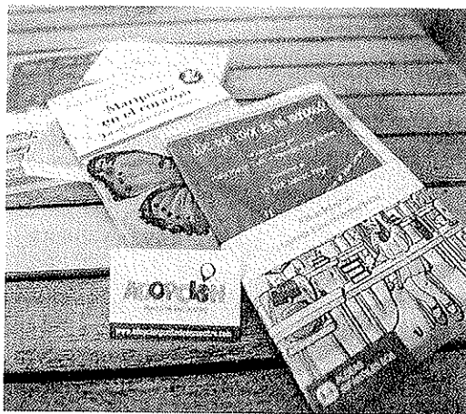
Cuento '¿De qué color es mi mariposa?' y libro 'Mariposas en el corazón'.