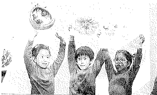
Niños chinos participando en un taller sobre la gastronomía de su país.

Se trata de un acto abierto a todo el público y sin límite de edad, en el que se podrá disfrutar y participar en actividades que pretenden acercar la milenaria cultura china a la nuestra. Entre las actividades que podrán realizarse se encuentran, por ejemplo, los cursillos de lengua china, que durarán 30 minutos, y que tiene el objetivo de ense-