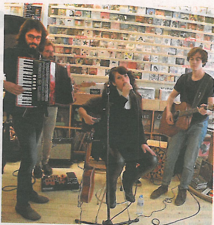
Estévez es una de las bandas que participan en el ciclo.