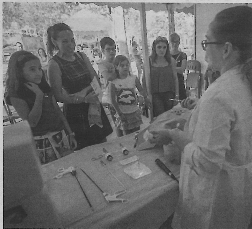
Uno de los talleres que se impartieron ayer en Granada.