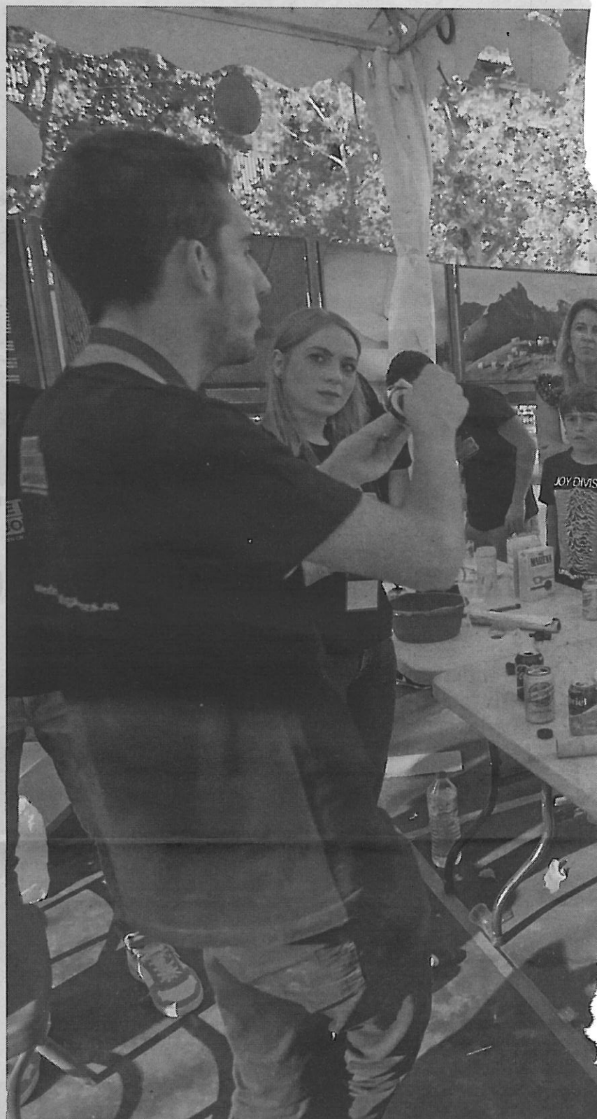
El público infantil se sumó de forma abrumadora a las actividades divulgativas

¿Serán los niños de hoy aquellos que construyan la Rosetta del mañana?