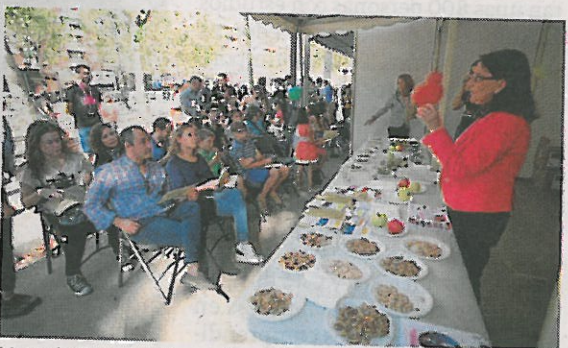
Una de las charlas sobre alimentación y salud. :: F.R.