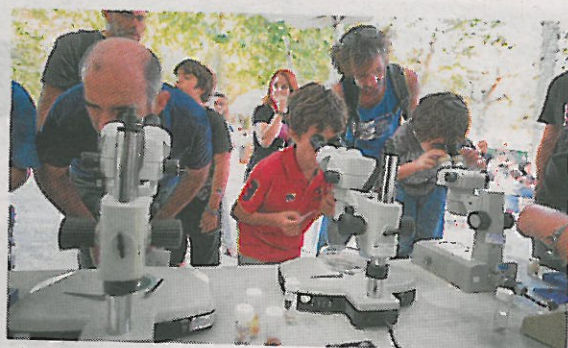
El público pudo usar máquinas de laboratorio. :: F.R.