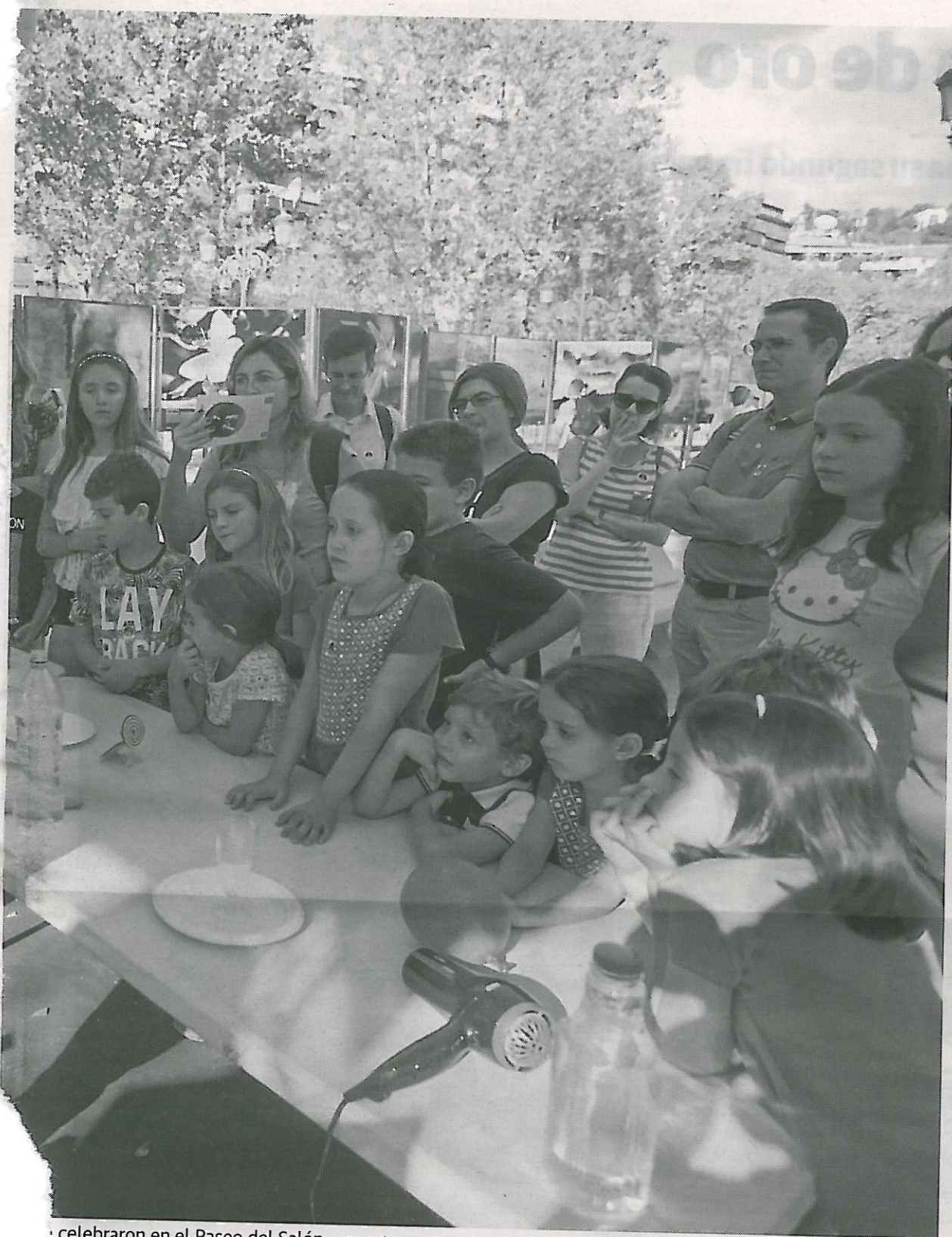
celebraron en el Paseo del Salón.