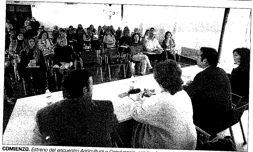
COMIENZO. Estreno del encuentro Agricultura y Convivencia, celebrado en el centro social de La Tejuela.

También se analizó la atención a los temporeros, con las experiencias de alojamiento y la utilidad de la bolsa de viviendas del Ayuntamiento. A continuación, la mediadora intercultural Elena Tajuela presentó el proyecto "Stop Rumores", contra los estereotipos negativos hacia los inmigrantes.