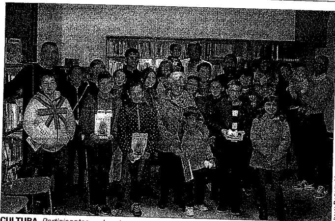
CULTURA. Participantes en la primera sesión del club de lectura de Alcalá.

Hinojosa manifestó que Alcalá siempre ha sido ejemplo como lugar de encuentro entre culturas, personas y realidades, y se ha fortalecido desde siempre por el intercambio. Añadió que la sociedad es un ejemplo de modelo de convivencia y solidaridad. Por su parte, la delegada subrayó que la provincia de Jaén es la única que cuenta con una red de albergues y destacó su buen funcionamiento desde que se creó.