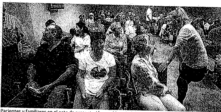
Pacientes y familiares en el acto de presentación en el hospital de Motril.