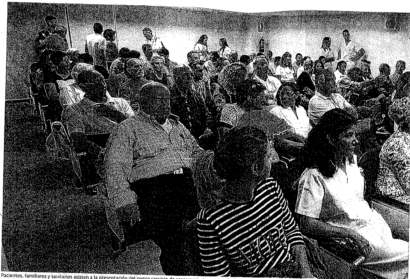
Pacientes, familiares y sanitarios asisten a la presentación del nuevo servicio de asesoramiento para pacientes ostomizados en la Costa.