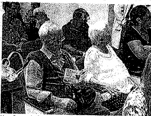
Un señor en el público lee un folleto informativo. J. J. MARTÍN

MOTRIL. La ostomía es una intervención quirúrgica que crea una comunicación artificial entre una víscera y el exterior a través del abdomen para conducir los fluidos corporales, materia fecal, urinario o secreciones del organismo. Puede ser permanente o temporal y, en general, se realiza en el intestino delgado, en el intestino grueso y en las vías urinarias. Esta es la explicación médica, aunque para muchos la ostomía sigue siendo sinónimo de pacientes que llevan el 'estigma' de la bolsa. Y en absoluto tiene por qué ser así ya que hoy en día existen dispositivos muy avanzados que permiten a la persona que ha pasado por estas intervenciones, necesarias para tratar distintas patologías como el cáncer, hacer una vida completamente normal cuando sale del hospital. Convencer de ello a las personas ostomizadas, ayudarlas a adaptarse a su nueva situación y a mantener su calidad de vida es el obje-