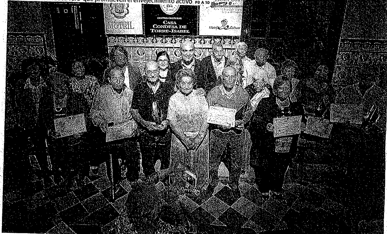
Foto de familia de los premiados en el certamen de Poesía y redacción 'Salvador Varo'.

El Consejo Municipal de mayores entrega los galardones del Certamen de Poesía y redacción 'Salvador Varo' que promueven el envejecimiento activo P8 A 10