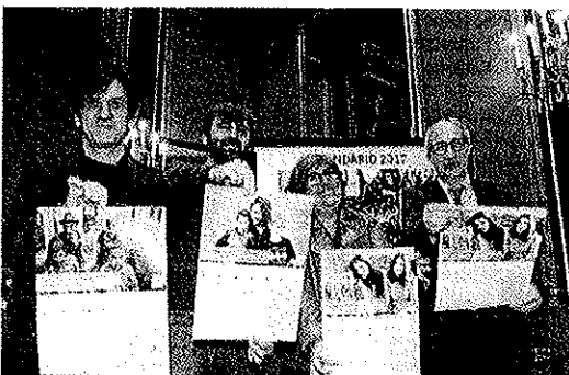
Los participantes muestran los calendarios solidarios de la asociación.