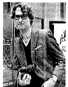
El fotógrafo Juanma Jiménez.