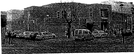
Imagen del Centro de Salud de Jódar.